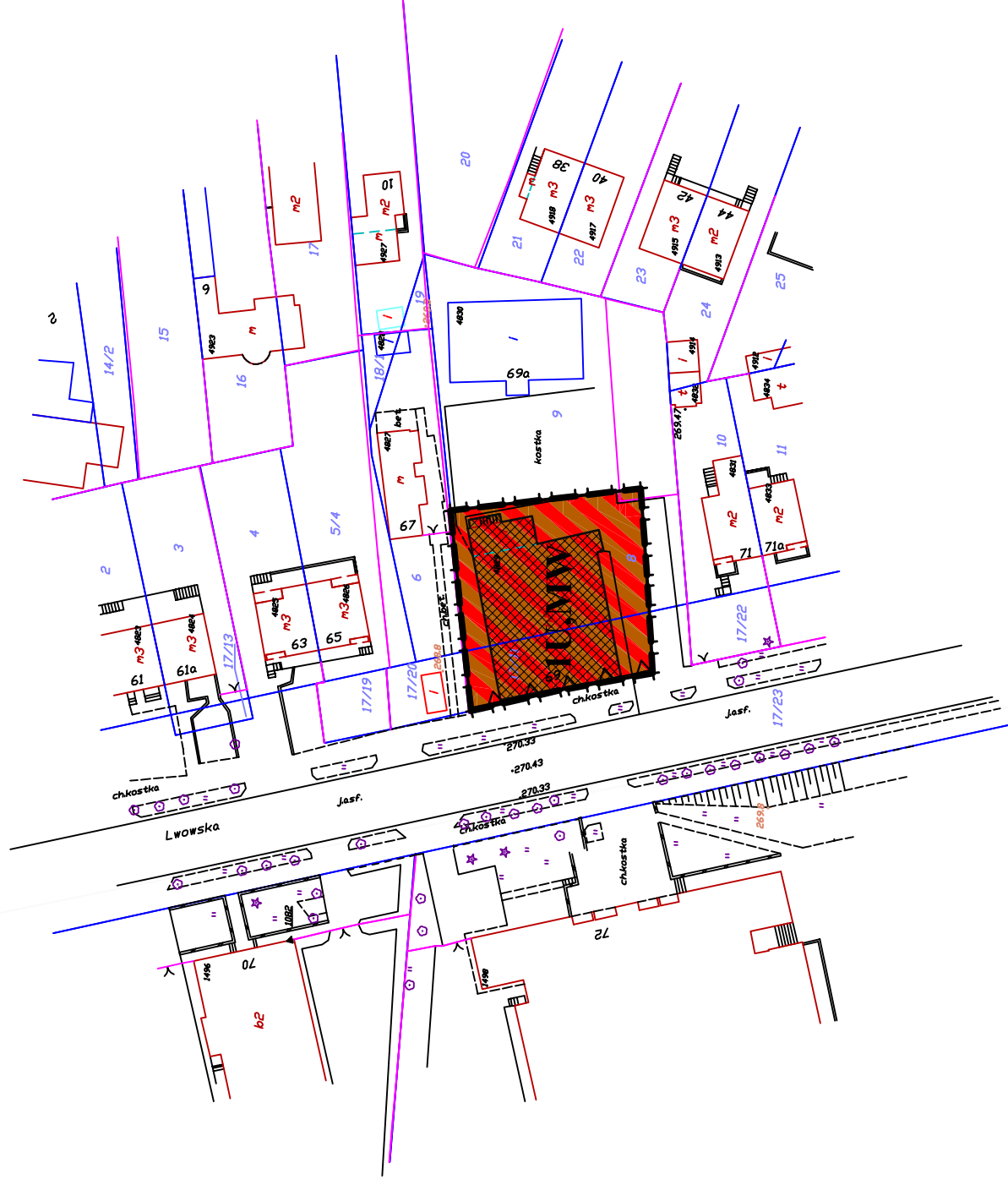
WYRYS ZE STUDIUM UWARUNKWAŃ I KIERUNKÓW ZAGOSPODAROWANIA PRZESTRZENNEGO MIASTA TOMASZÓW LUBELSKI